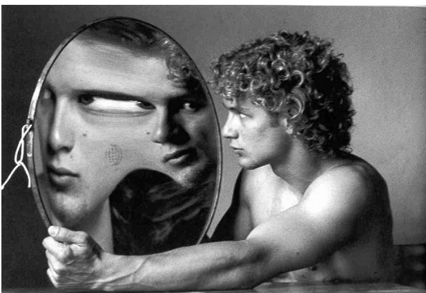
Espelho , de Duane Michals